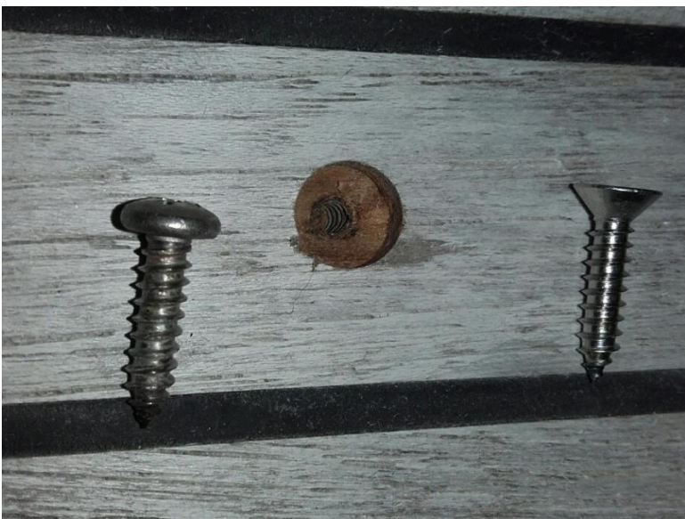
Foto 1. Hullet boret op og klar til den nye skrue til højre.

Anvend den nye skrue med undersænket hoved.