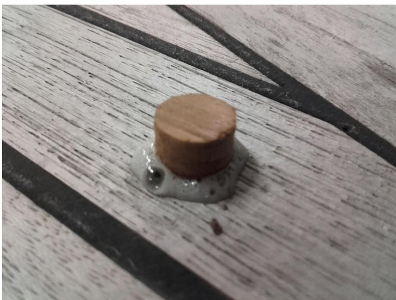
Foto 6. Limen er tør når skummet er hårdt

Dagen efter monteringen af de nye propper, er skummet omkring proppen hårdt og du kan arbejde videre.