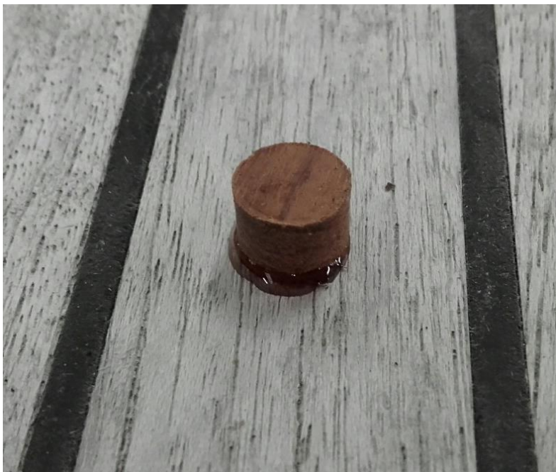
Foto 5. Ny prop monteret i lim