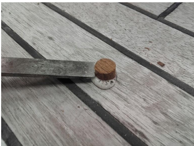
Foto 7. Stik proppen af med et skarpt stemmejern med slibningen nedad.