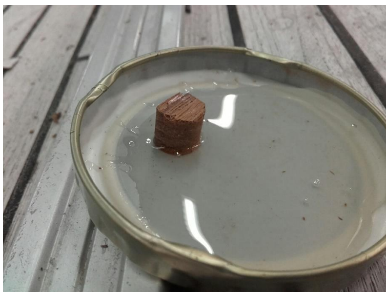
Foto 4. Skub proppen ind i limen og undgå lim på enden af proppen

Placer proppen i hullet og drej den så årenerne er parallel med dækkets årer. Slå let med en lille hammer til du kan høre, at proppen rammer skruen. Lad limen tørre ca 24 timer før du kan arbejde videre. Pas på ikke at træde på dine reparerede propper når du går på dækket.