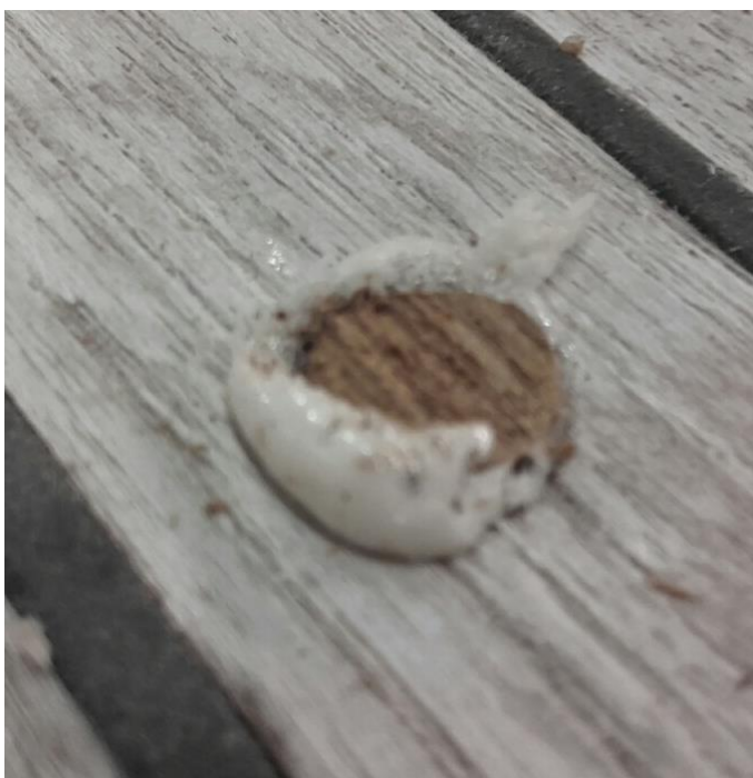
Foto 8. Proppen er stukket af med stemmejern. Ca 1-1,5mm over dæk. Denne prop flækkede ret med dækket, hvorved den kan slås ned til ca 1 mm.

Nu mangles kun slibning, som kan gøres med sandpapir kor 80 på en pudseklods, eller (hurtigere) evt med en Eksentersliber og forsigtighed. Slib til proppe er plan med dækket.