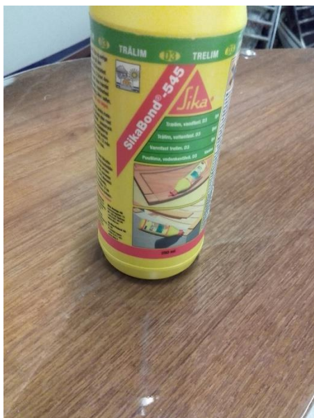
Foto 3. Vandfast lim Sikabond 545

Hæld en lille smule lim ud på en plan flade. Et låg fra et marmelade-glas er velegnet, da kanterne forhindrer lim spild. Stil proppen på enden uden for "lin-søen" og drej den ind igennem limen. Derved undgår du lim på undersiden af proppen, som blot vil fylde kærven af skruen, så den på et senere tidspunkt bliver vanskelig at skrue ud.