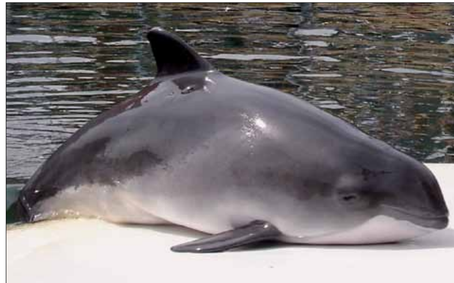
Der er mange små hvaler i både lillebælt og Kattegat og Øresund. De små tumlere kan også ses i Naturpark Lillebælt, hvor hvalerne studeres.

Marsvin ( Phocoena phocoena ) er den mindste tandhval.