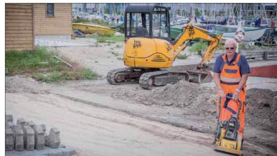
Arbejdet med at anlægge en ny bom ved slæbestedet forventes færdigt, når dette blad læses.