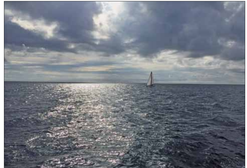
Sommerturen gik til Anholt - læs artiklen side 4

6. Havnen. Blev bygget af staten i årene 1899-1903 og omfatter fiskerihavn, lystbådehavn og tærgelje.